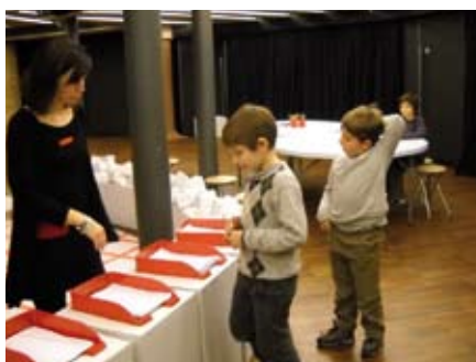
Buscant el planell d'un teatre per pintar-lo i construir-lo