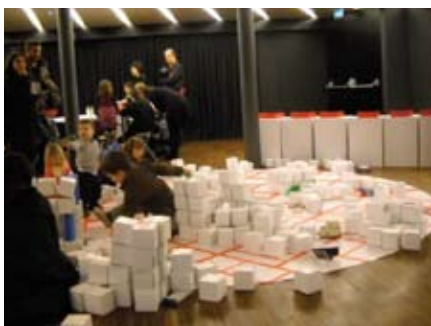
Hem fet una església amb una torre