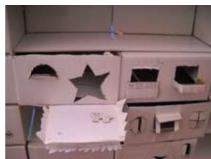
A l'entresol de la Pedrera, els nens i nenes estan construint una enorme façana! Cadascú dissenyava la seva pròpia casa i la posava al costat de les demés. Fins i tot algú a posat un petit terrat per el gos!