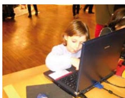
Hem vingut a la Pedrera i hem jugat als sons de la ciutat. M'agradat molt