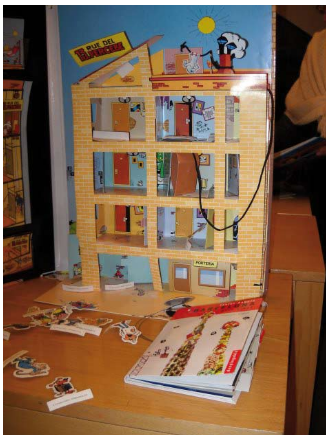
També han fet un taller de contes y altres tallers.