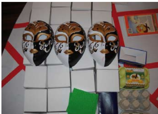
Un teatre dissenyat per un nen o una nena