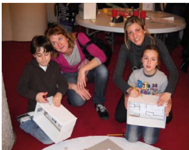
És el taller de muntar façanes.