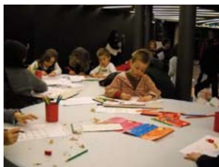
Per dibuixar, montar i llegir