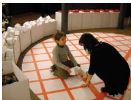
El Pau fa el teatre