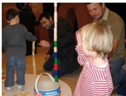
Els més petits i no tan petits