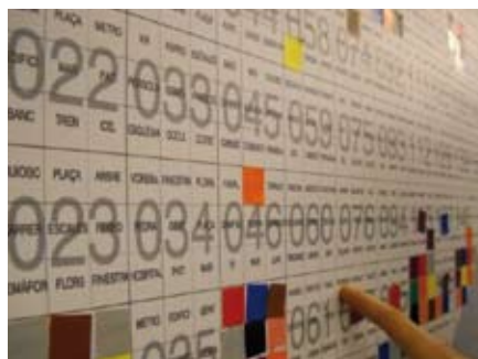
Avui hem comprovat la dificultat de fer un arc