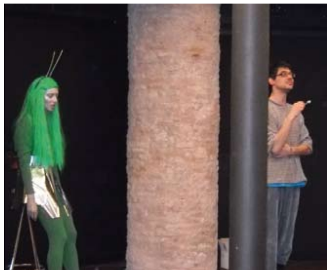
La Marciana en un moment de la representació

En motiu de la festa familiar de l'arquitectura, s'ha representat a la Sala Gaudí de La Pedrera l'obra La Marciana i el Terrícola. La petita peça teatral ha tirat al voltant de l'arquitectura en comparació amb el cos humà.